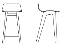
Sitzhöhe // Seating h 66