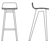
Sitzhöhe // Seating h 80